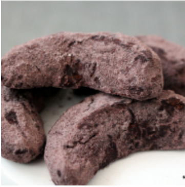
Clean baking zu Weihnachten: aromatische Kekse, Kinfert