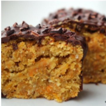
Pünktlich zu Ostern: cremiger Carrot-Kokos- Kuchen [vegan]