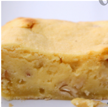
Cremig-buttrige Eierlikör-Blondies [mit salzigen Erdnüssen]