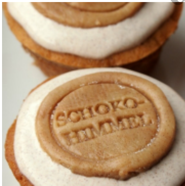
Zimt-Muffins mit Zimtcreme und Zimt-Marzipan (habe ich Zimt gesagt?)