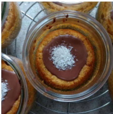
Carrot-Kokos-Küchlein [Ostern kann kommen]

Oster-Gebäck aus der Schokohimmel-Backstube