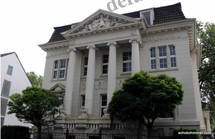
Impressionen Dortmunder Kaiserviertel