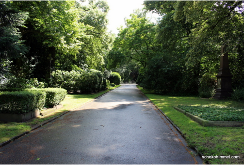
Impressionen Dortmunder Kaiserviertel