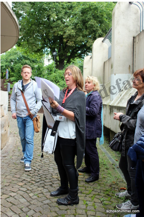
Foodie-Stadttour durch Dortmund

Ein Geschäft für frische Nudeln und Antipasti merke ich mir dagegen auf jeden Fall – Pasta fresca für Zuhause kaufen, das muss ich unbedingt bald machen. Da bin ich zur Eigenproduktion doch zu faul ? . Zum Abschluss gab's noch ein leckeres Stückchen Lachs-Quiche in einem gemütlichen Zwischending aus Bistro, Café, Kneipe und Restaurant mit offener Küche – satt und mit vielen neuen Eindrücken ging die Tour nach über drei Stunden zu Ende. Einzig eine Bier-Kostprobe hätte ich mir doch gewünscht, war Dortmund doch lange die Bierstadt schlechthin. Aber Alkohol gibt's grundsätzlich nicht als eigene Station bei eat-the-world.